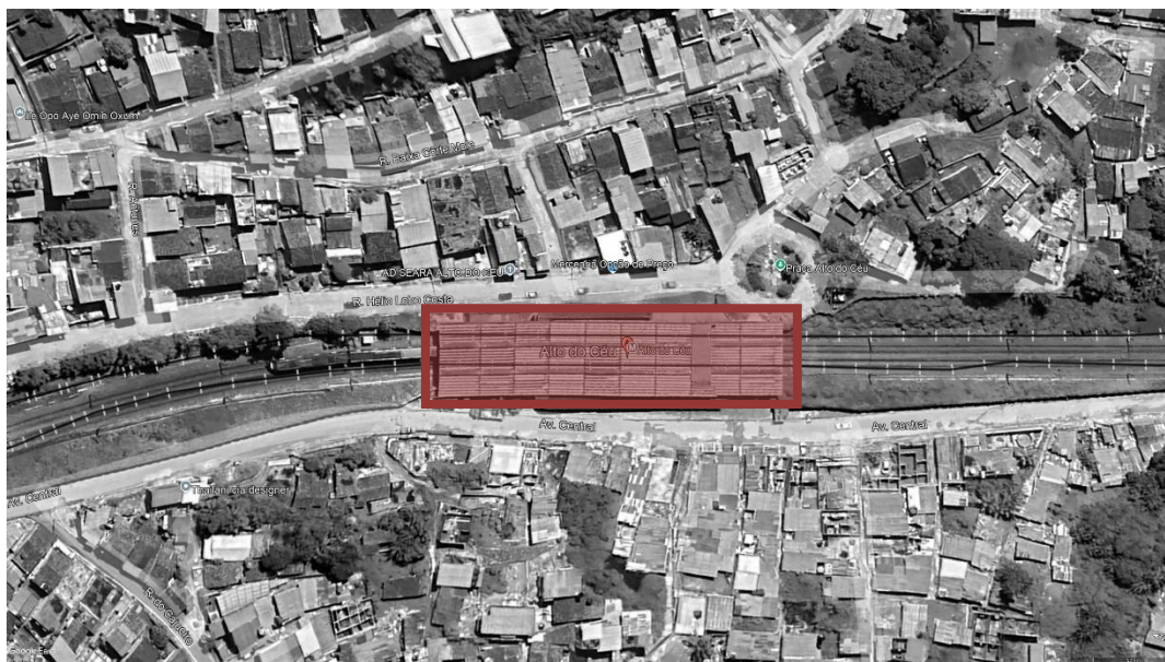
FIGURA 1 – ESTAÇÃO ALTO DO CÉU